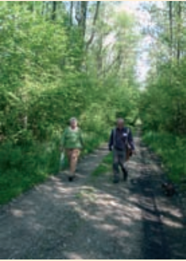
Wanderer im Sinsbucher Forst

Die häufig auftretende Legende, in der erzählt wird, dass das Heiligenbild immer wieder zu dem Baum, in dem es gefunden wurde, zurückkehrt, liest man auch von Niederleierndorf. Dort