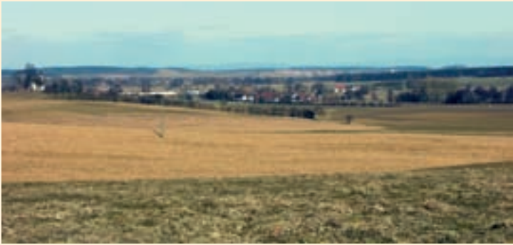
Tal der Großen Laaber

Tal der Großen Laaber – eine historische Kulturlandschaft